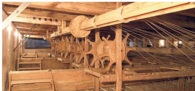
Hier wird noch alles mit Muskelkraft bewegt: Blick in eine barocke Opernbühnenmaschinerie

te und flirtete, intrigierte und sich bei Gelegenheit auch duellierte – wir wissen das heute erstaunlich detailgenau. Damals standen Hunderte Zuschauer, in den größeren Häusern auch mehr als tausend im Parkett oder drängten sich in steilen Logen, die heute keine Feuerpolizei mehr genehmigen würde. Im neuen San Cassiano sollen es gut 400 Zuschauer in gerade einmal sechs Sitzreihen sein.