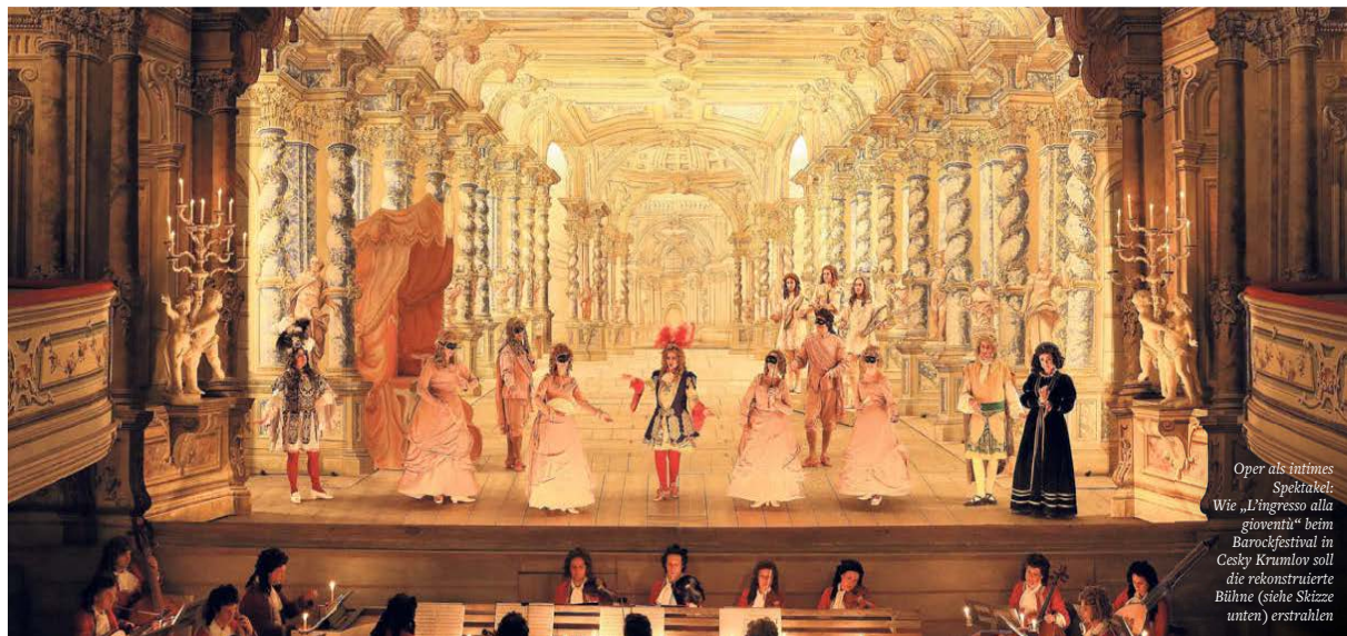
Oper als intimes Spektakel: Wie „L'ingresso alla gioventù“ beim Barockfestival in Cesky Krumlov soll die rekonstruierte Bühne (siehe Skizze unten) erstrahlen

BILD: FOTO SVACEK/CZ; THEATRO SAN CASSIANO (D)